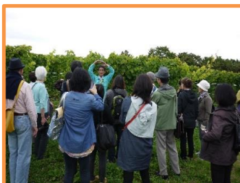
空知産ワイン生産基盤整備促進事業(空知総合振興局)